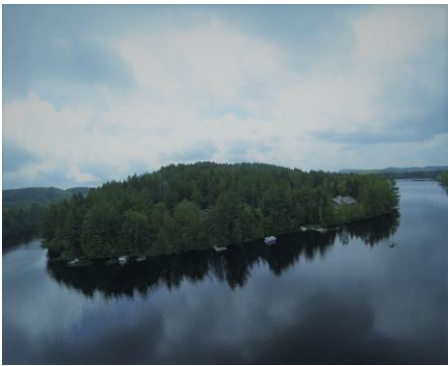
Vue aérienne du lac Desmarais